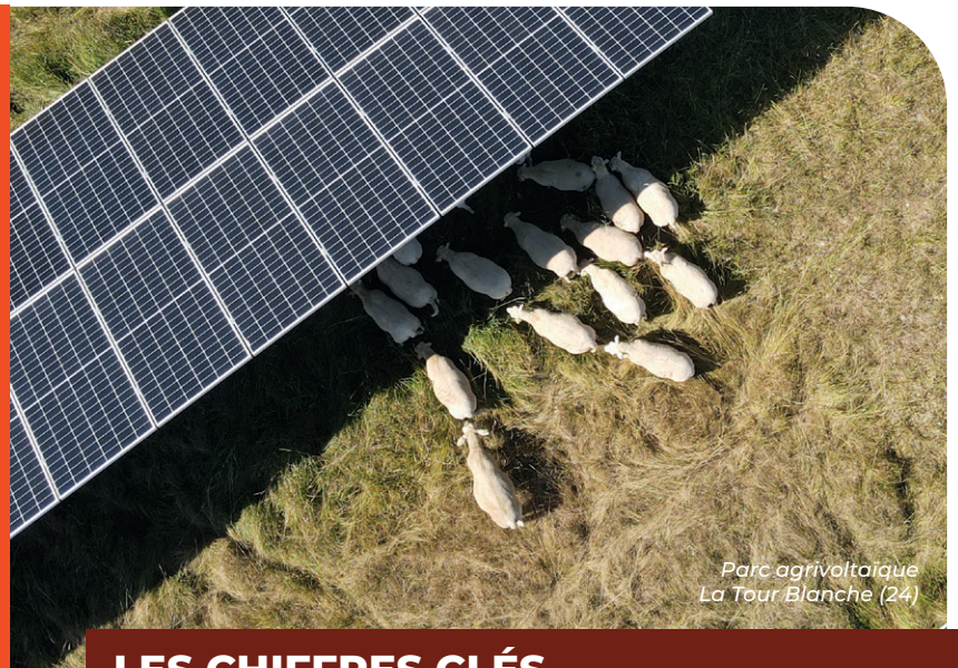
Parc agrivoltaïque La Tour Blanche (24)

Ce modèle permettrait de relancer une activité agricole dans un espace clos et sécurisé . Conçue pour cohabiter au mieux avec les animaux, la future centrale offrirait un environnement protégé , assurant la sécurité du troupeau et lui procurant l'ombre nécessaire lors des fortes chaleurs, tout en favorisant la pousse du fourrage.